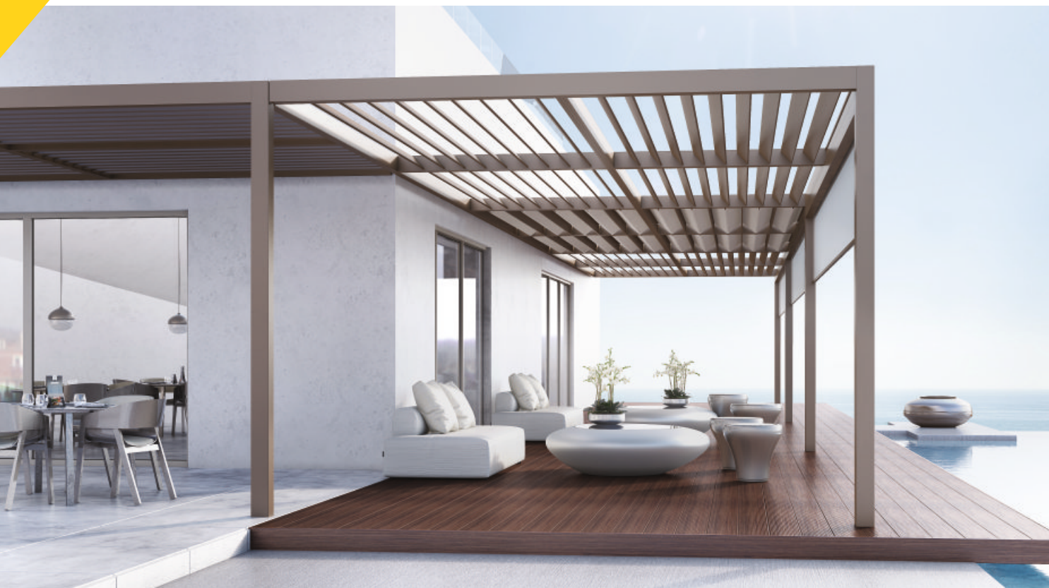
Απλή συναρμολόγηση όλων των στοιχείων για γρήγορη και εύκολη τοποθέτηση (4 βήματα)

Σχεδόν όλες οι εργασίες γίνονται στο κατασκευαστικό εργαστήριο και στη συνέχεια η εγκατάσταση πραγματοποιείται πολύ εύκολα και γρήγορα στον χώρο του έργου.