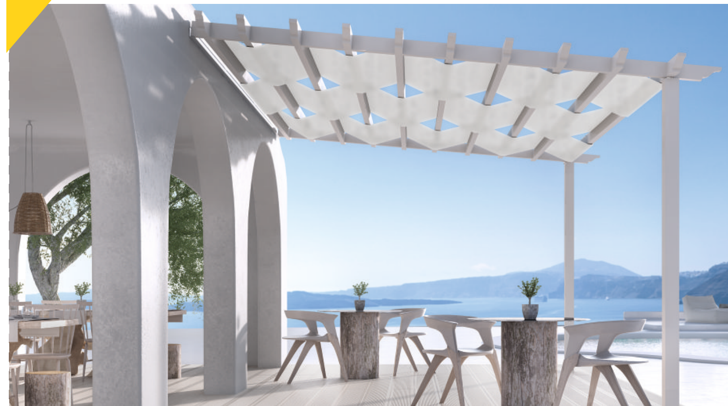
Ρυθμιζόμενες συνδέσεις περσίδων